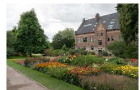
Botanisk have Lund