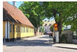
Lund gamle by

Vi skal selvfølgelig også nyde den smukke gamle by og besøge Botaniske have.