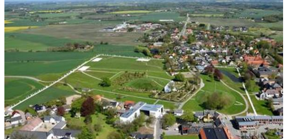
Kongernes Jelling, Gormsgade 23, 7300 Jelling

Betaling ved tilmelding som er senest 1. maj 2024.