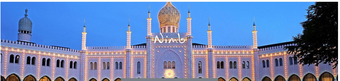
Nimble i København