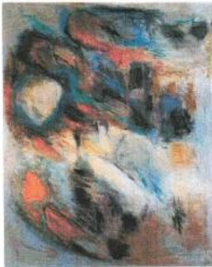
Kunstner Grete Bille