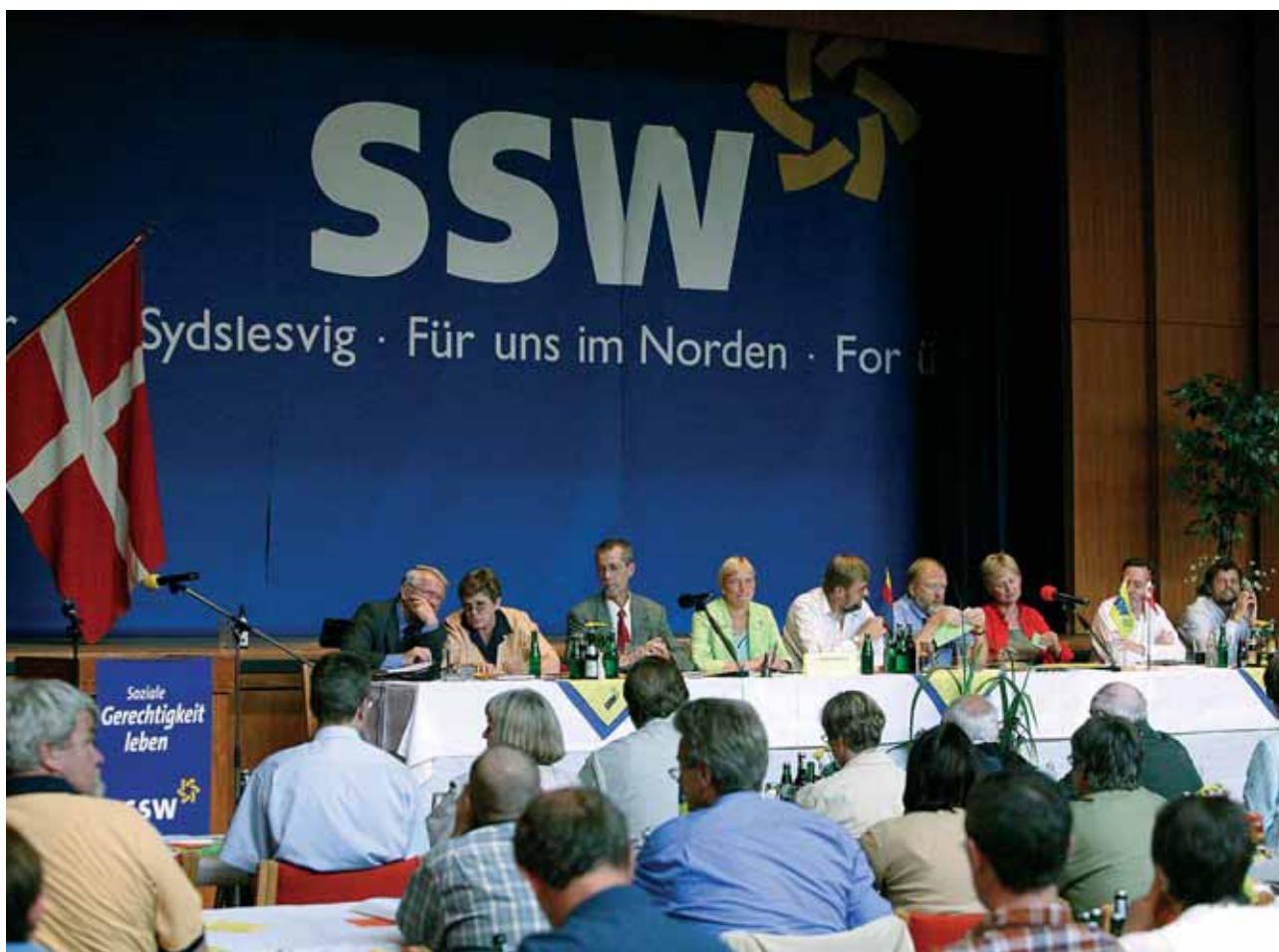
Et glimt fra SSW's landsmøde.

andre«. Vi lever af solidariteten inden for mindretallet, men styrken i SSW's politik er, at vore politiske mål ikke går ud på at være lobby for mindretallet, men at forandre det slesvig-holstenske samfund på en sådan måde, at det bliver et bedre sted for både mindretal og flertal.