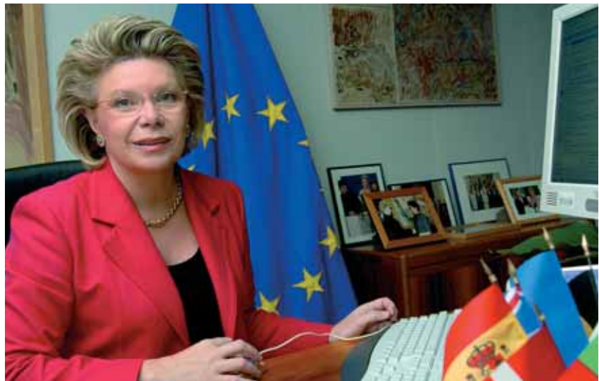
Næstformand for Europa-Kommissionen og kommissær for retlige anliggender, grundlæggende rettigheder og EU, Viviane Reding: - Kommissionen vil sikre, at mindretallene respekteres inden for rammerne af EU-lovgivningen.

Artikel 21 i EU-charteret om fundamentale rettigheder, som er blevet bindende, efter at Lissabontraktaten er trådt i kraft, forbyder eksplicit diskrimination på baggrund af sprog eller medlemskab af et nationalt mindretal som et led i anvendelsen af EU-lovgivningen. Kommissionen sikrer, at de funda-