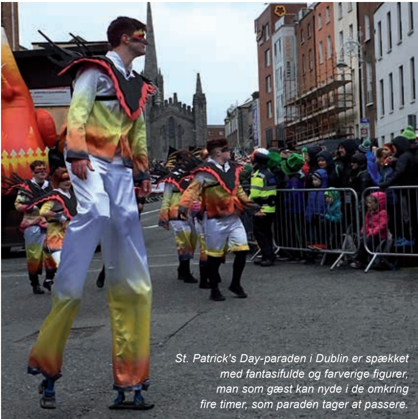
St. Patrick's Day-paraden i Dublin er spækket med fantasifulde og farverige figurer, man som gæst kan nyde i de omkring fire timer, som paraden tager at passere.

Den farvestrålende parade rummer fantasifulde udklædninger, overdimensionerede figurer og en lang række amerikanske musikbands – det anslås, at der som regel er flere end 2.000 bandmedlemmer, som er med i paraden i Dublin – og dertil kommer så de mange foreninger og organisationer, som også deltager i paraden.