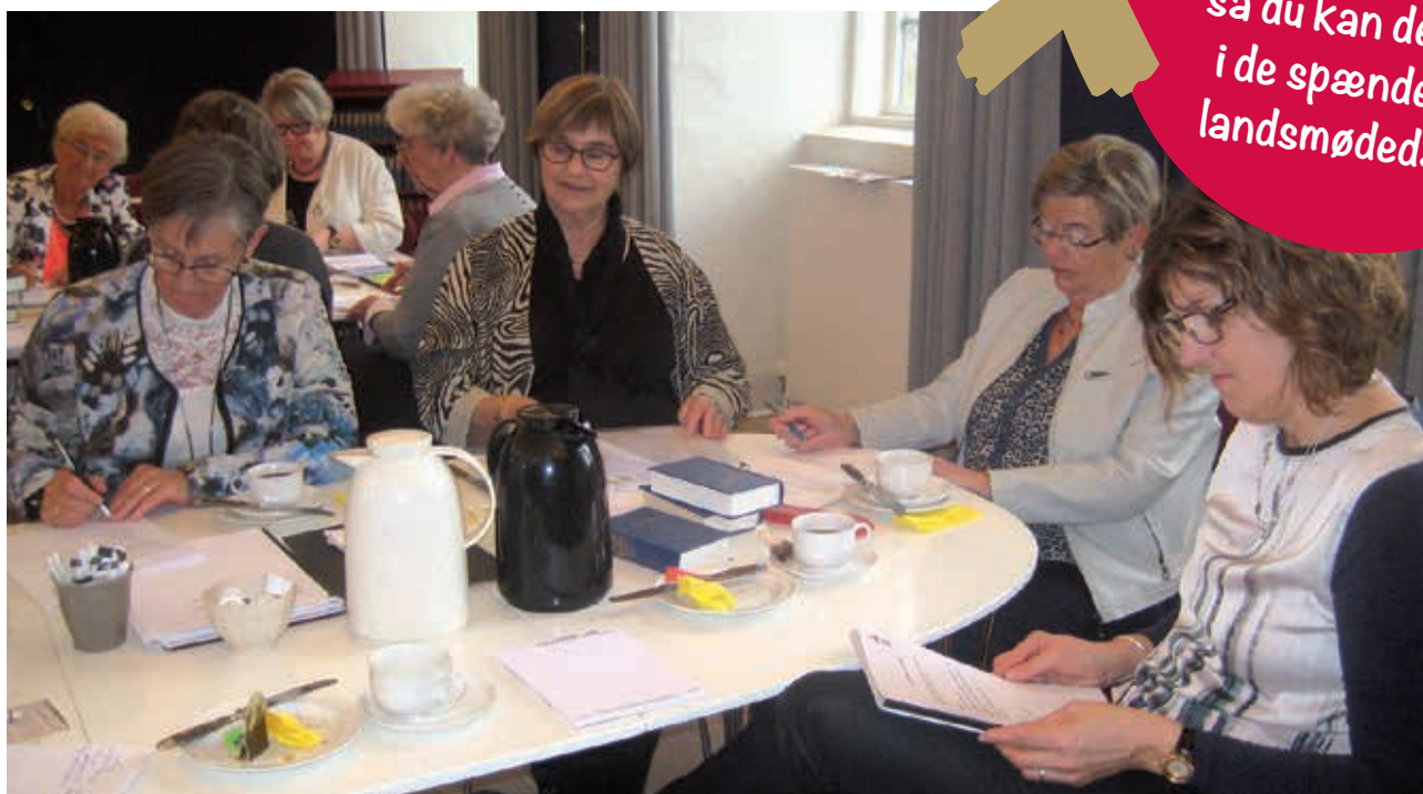
Folkevirkes årlige landsmøde er altid en stor oplevelse med givende samvær. Folkevirke fortsætter også i 2019 med at invitere til et to-dages møde, som ud over landsmødet også byder på socialt samvær, et spændende oplæg og en kulturel oplevelse.

Der planlægges med landsmøde den 10.-11. april 2019 i København.