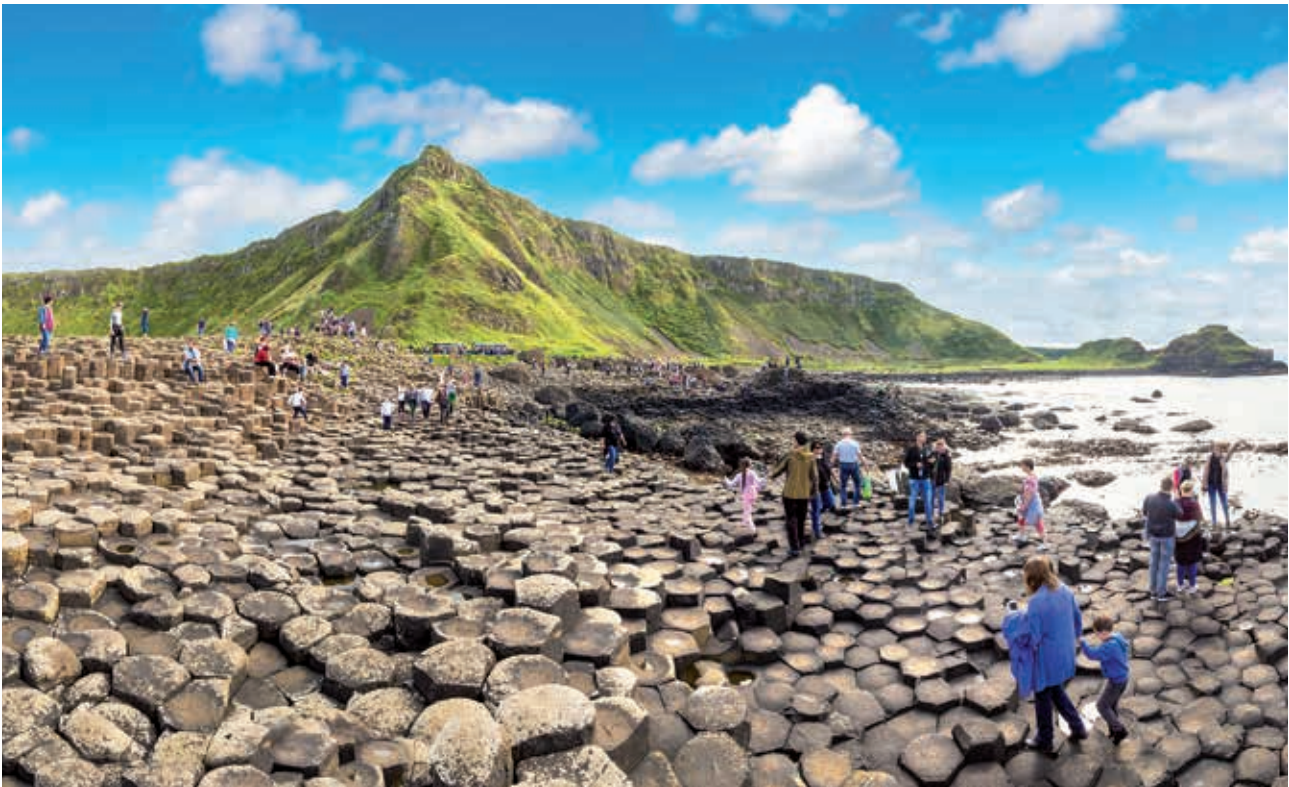
The Giant's Causeway er en af Nordirlands største turistattraktioner og er på UNESCO's Verdensarvsliste. Mange kommer fra Irland for at se den nordirske seværdighed – og skal altså om et lille års tid rejse ud og ind ad EU for at gøre det.

værdi af mere end én milliard kroner i Argentina, Brasilien, Nordamerika, Indien og Kina.