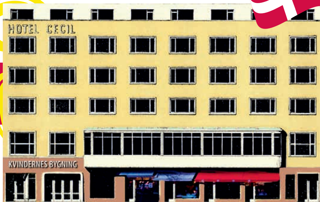
Tegning af Kvindernes Bygning, som den så ud ved indvielsen i 1936, hvor Hotel Cecil lå på de øverste etager.