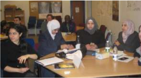
Et glimt fra besøget på Kalundborg Sprogskole.

Under overskriften ”Dansk mangfoldighed” har Folkevirke taget hul på et spændende projekt med et relativt langt forløb. Det løber over halvandet år.