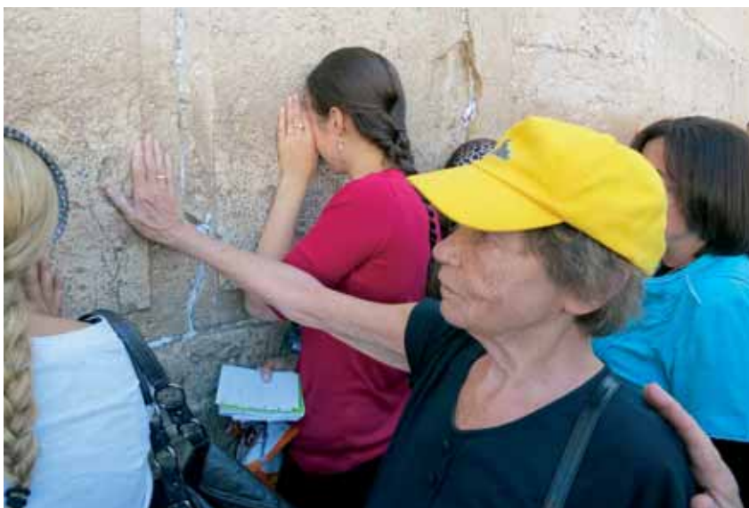
Når blinde og svagtseende er på rejse, så foregår flere af oplevelserne gennem hænderne, som på mange måder er de blinde og svagtseendes »øjne«.

Et tæt samarbejde mellem de nordiske blindeorganisationer blev inspirationen til, at Dansk Blindesamfunds Kvinder blev dannet. Især norske og svenske kvinder med synshandicap var foran os. De var for længst i gang med Berit Ås' Herskerteknikker og kvindekommité/-udvalg. I Danmark var vi enige om, vi nok ikke ville komme ret langt med revolution og oprør, så beslutningen blev: Ansøgning om penge til kurser til uddannelse i simple ting som møde og taleteknik – »Stå frem og bliv hørt«. Alle kvindelige medlemmer af Dansk Blindesamfund kunne deltage, og den eneste bundne opgave efter et sådant kursus var at danne en net-