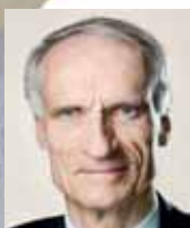
Aftidligere undervisnings- minister Bertel Haarder

I det følgende vil jeg fortælle om to elefanter, en stor og en mindre. Jeg elsker elefanter. De er fredssommelige, står tungt og pruster og basker med ørene. De er enorme, men har slet ikke den styrke, som deres vægt og størrelse berettiger til. De er kloge, men er alligevel lette ofre for krybskytter, som vil have deres stødtænder.