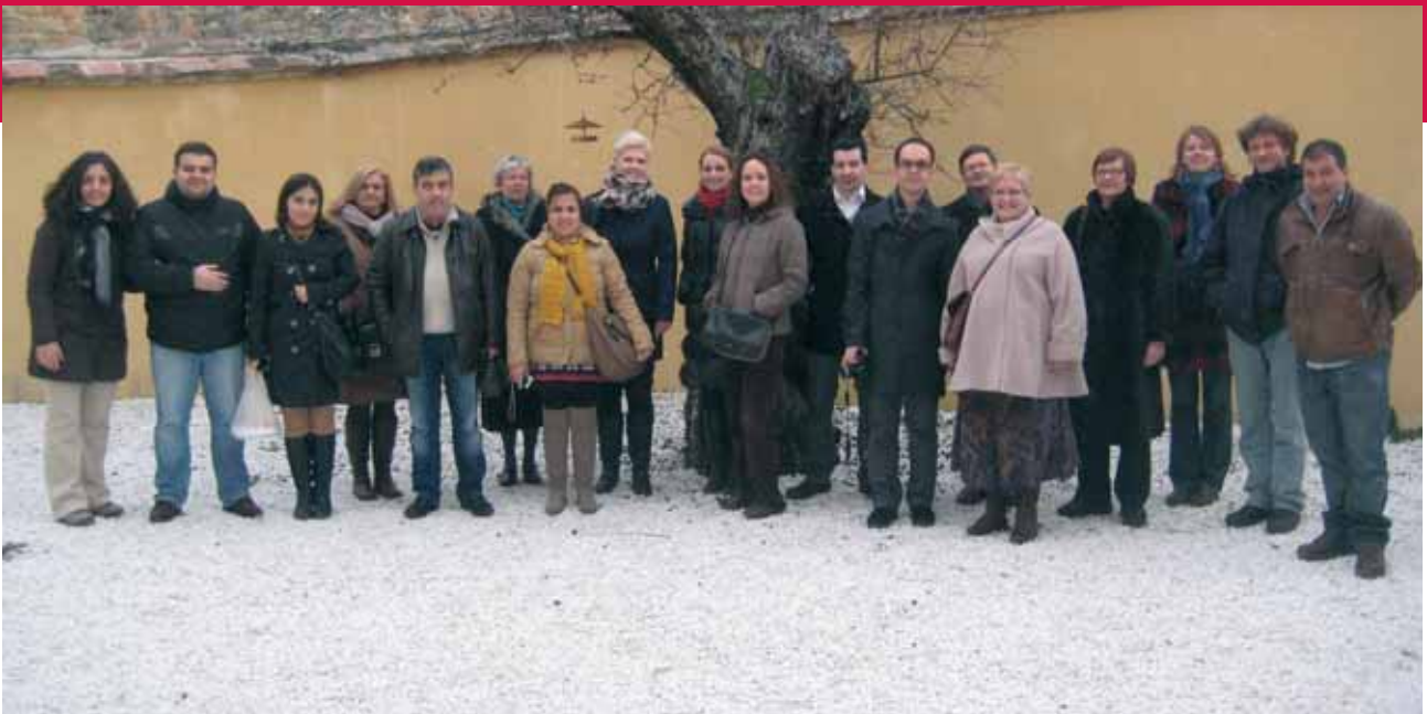
En godt sammentømt gruppe af internationale folkeoplysere, som har arbejdet intenst med det EU-støttede projekt »Cultural Kaleidoscope«.