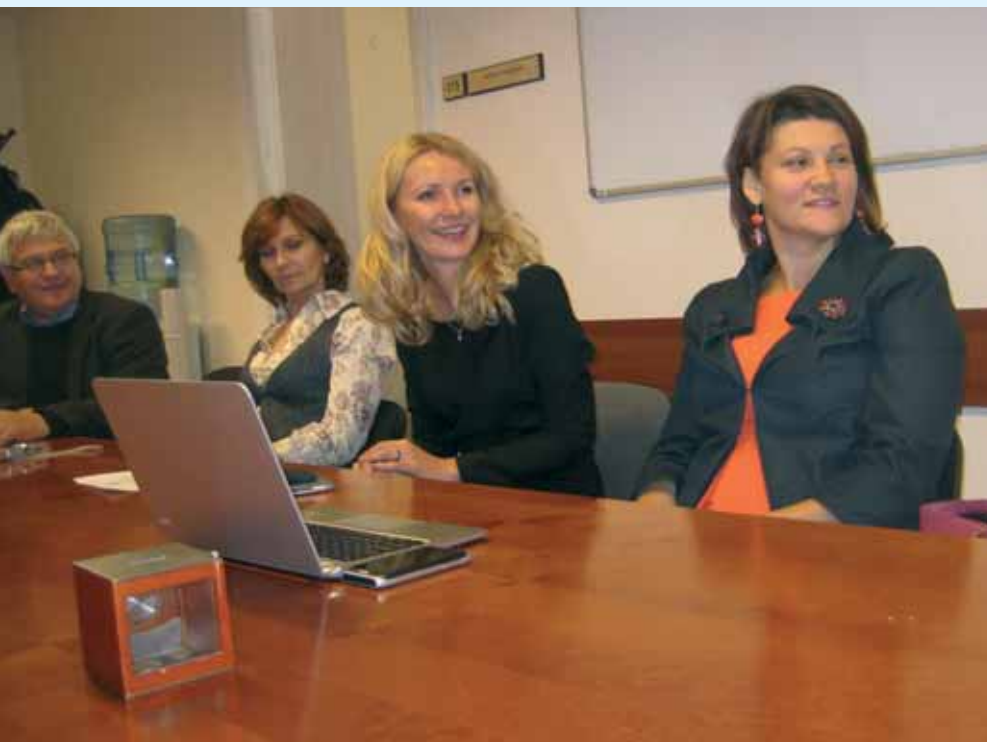
Glimt fra projektmøde i Nordplus-projektet »New and old democracies« – her et besøg med lettiske politikere i Riga.

Resultater af almen interesse bliver lagt på projektets hjemmeside.