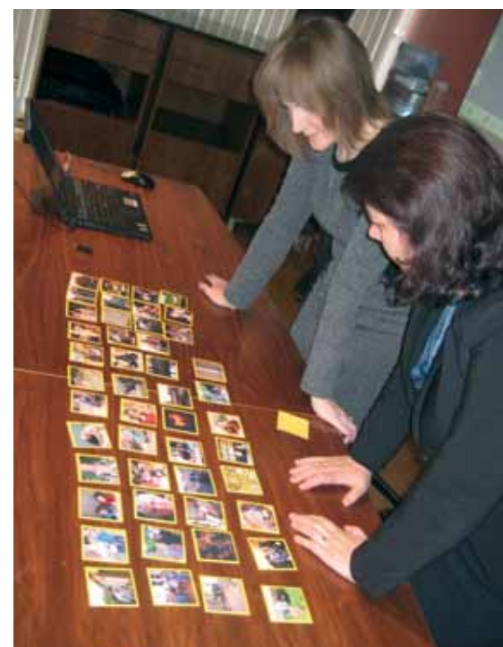
Under et lettisk projektmøde i Nordplus-projektet »New and old democracies« blev deltagerne bedt om at arbejde med Folkevirkes »Kulturmosaikker«.

den, der gjorde det største indtryk. Det var Norges nationaldag – uafhængighedsdag. Her blev Norges 199 års uafhængighed markeret. Det var på denne dag i 1814, at Norges grundlov blev underskrevet. Det er den største nationale fejring i Norge. Alle – store som små – er klædt i nationaldragter, vifter med det nationale flag eller bærer det norske flag som bånd.