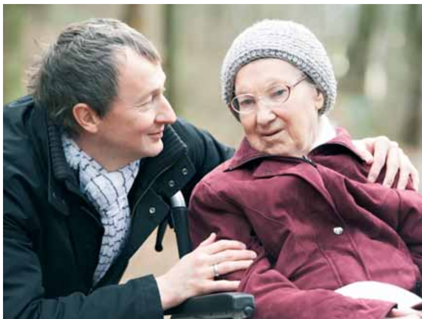
Ud over de helbredsrelaterede forhold har antallet af besøg stor betydning for ældres livskvalitet.

Plejeboligerne skal indrettes så enkle og hverdagsagtige som muligt. Der skal være to værelser, og arkitekterne behøver ikke nødvendigvis at placere opholdsstuen op mod toilettet med en stor skydedør imellem. Boligen skal åbne sig mod den nye teknologi, som både kan være arbejdskraftbesparende og sikre beboeren en større integritet. I det gode plejehjem er der en forståelse for, at hjemmet er beboernes hjem, før det er nogens arbejds-