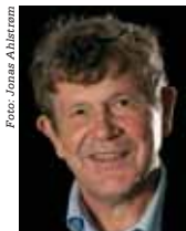
Af Arne Rolighed, formand for Danske Pensionister, medlem af Ældre- kommissionen, fhv. sundheds- minister

Arne Roligheds indlæg tager udgangspunkt i Ældrekommissionens anbefalinger om indretning af boliger til de ældste og svageste, der har brug for plejebolig eller plejehjem