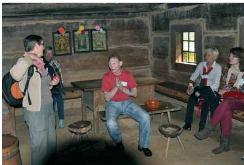
Et glimt fra et af museumsbesøgene, hvor deltagerne fik et godt indblik i den polske folkekultur.

Den polske projektpartner har derfor i dette projekt kun arbejdet blandt mindretal. Og i denne grænseegn er der til gengæld mange at vælge imellem!