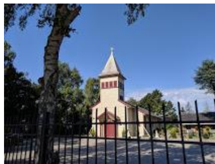
Skt. Maria & Skt. Markus

Der er planlagt et besøg i "Den Koptiske Ortodokse kirke", Taastrup Hovedgade 162, 2630 Taastrup