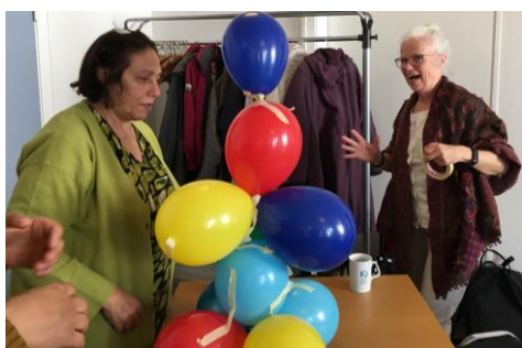
Kunsten at samarbejde

Deltagerne fik mulighed for at deltage i forskellige workshops, hvor nogle af de udenlandske ideer blev prøvet, ligesom man også diskuterede de forskellige kulturopfattelser og kulturmønstre, som man typisk møder ved at deltage i de udenlandske projekter. Det gav anledning til gode og tankevækkende debatter om bl.a. hvordan de forskellige kulturer betragter døden og de særlige ønsker, som man har forskellige steder i verden til selve begravelsen/bisættelsen.