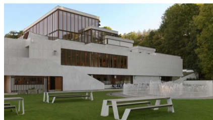
Kunsten Museum of Modern Art Aalborg